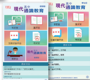
教師備課 APP、學生學習 APP