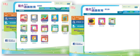
教師、學生專用網站